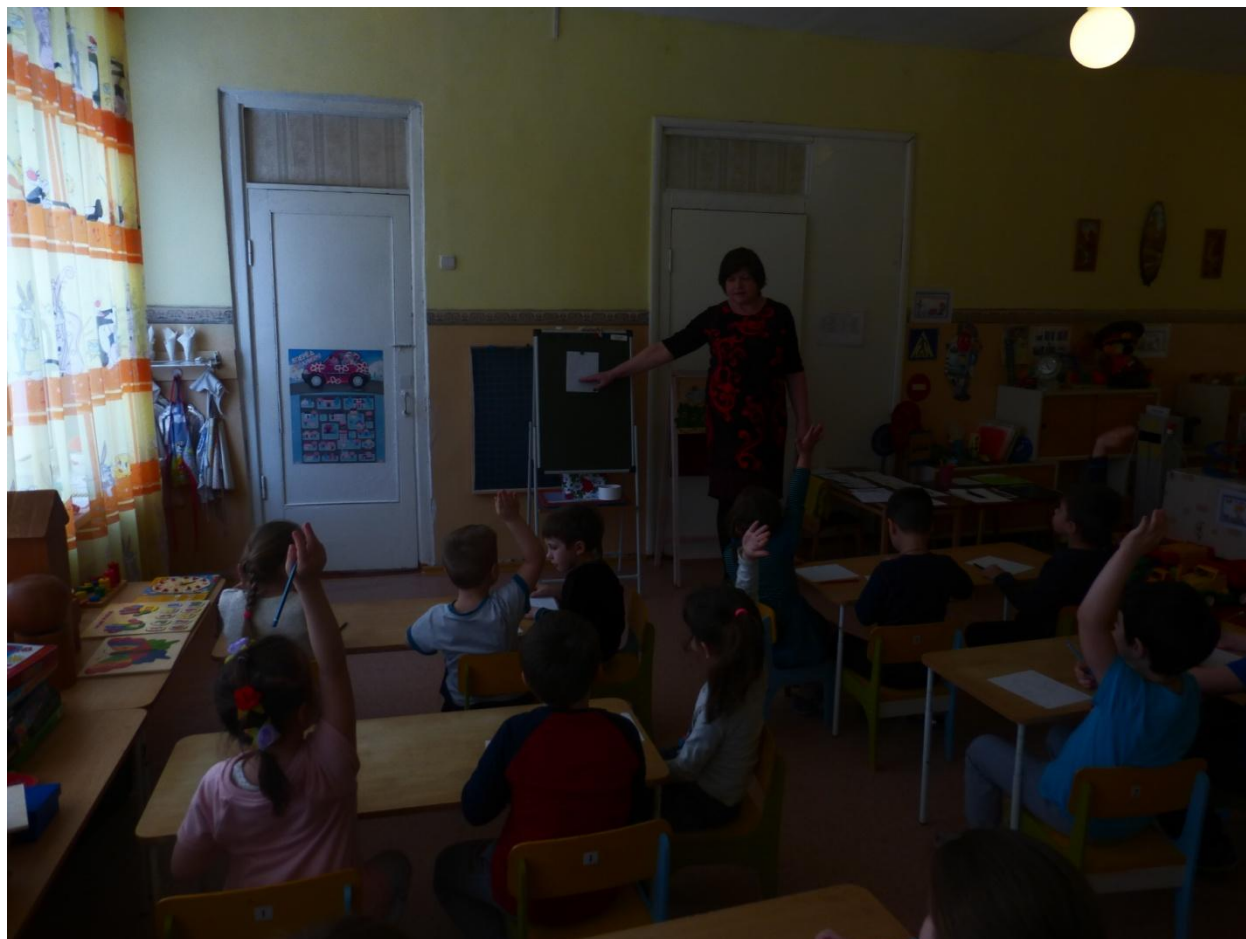
Игра «Выбираем транспорт»

В начале собрания для родителей было показано занятие с детьми на тему: «Путешествие в страну Всезнаек»